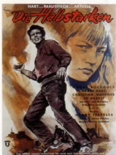
„Die Halbstarken“ war der plakative Titel eines Films, der 1956 in die deutschen Kinos kam. In einer der Hauptrollen: Horst Buchholz (oben ein Plakat).

Zwischen 1956 und 1958 wurde die Bundesrepublik von zahllosen Halbstarken-Krawallen heimgesucht. Doch so viel Mobiliar bei Rockkonzerten auch zerschlagen wurde, das Selbstverständnis der Wirtschaftswunderjahre stellten die Halbstarken nicht in Frage.