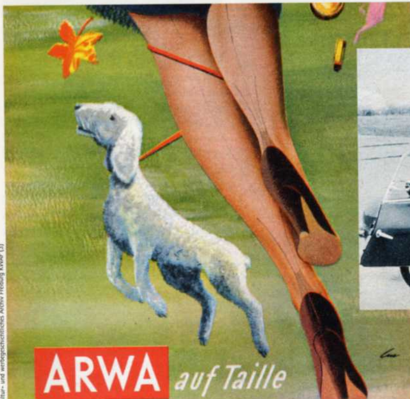
Kultur- und werbegeschichtliches Archiv Freiburg KWAF [3]

bewerbs und damit der „sozialen Marktwirtschaft“ zur raschen Entfaltung kommen konnten – mit dem neuen „guten“ Geld als nunmehr einzig gültigem „Bezugsschein“ für Waren und Dienstleistungen aller Art. Den westdeutschen Verbrauchern erschien die wundersame Verwandlung des öffentlichen Raums wie ein Märchen aus Tausendundeiner Nacht – für jeden nüchtern denkenden Kaufmann bedeutete dieser Montag jedoch nichts anderes als die Rückkehr zum normalen, von Angebot und Nach-